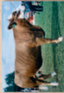
Wenner: Duitse Ambassadebeiker • Windhoek, Skou 2003