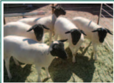
Bo: Karasberge Boerevereniging se groepie doper ooië het die kuddekompetisie gewen

Nodeloos om te sê dat die dames ook hulle eie, baie interessante program die twee dae gehad het. Praatjies oor onderwerpe soos gesondheid, skoonheidstegnieke, versorging van juweliersware en kleipotte en kleiprodukte het die dames vasgenaël gehou vir 'n hele paar uur.