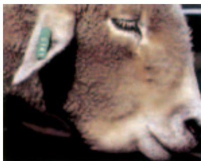
Kwakkeel (n waterige sak wat onder die keel hang, soos op hierdie foto) en bleek oogslimvliese is van die sigbare tekens van haarwurmbesmetting

In die proef is Trodax met welslae teen die Nootgedacht-sowel as die Kokstadstam gebruik (teen die aanbevole dosis van 1ml/25kg liggaamsgewig). Skaapboere hoef dus nie meer te wonder oor watter haarwurmstam dit is wat vir hulle probleme veroorsaak nie. In die vorige proef is reeds bewys dat Trodax, ook teen die normale dosis toegedien, korte mette met die weerstandbiedende Witrivier-haarwurmstam maak.